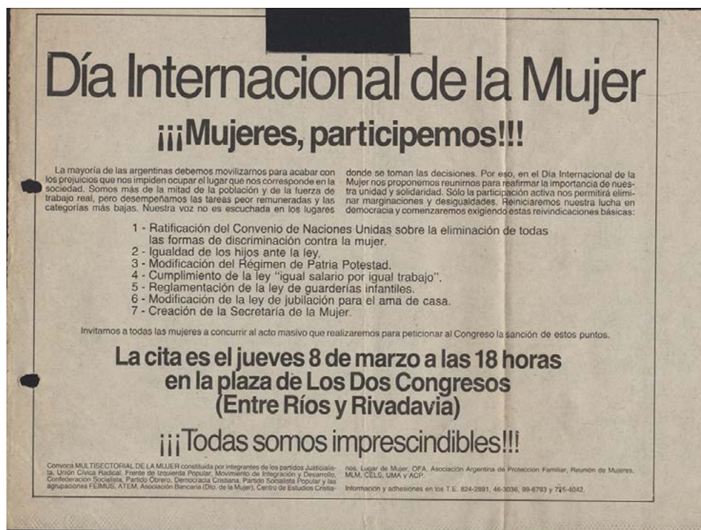
Multisectorial de la Mujer, 8 de marzo de 1984 (Fondo Elsa Cola Arena, Memoria Abierta).

Una agenda centrada en las demandas propias de un movimiento de mujeres diverso y con anclajes sociales múltiples, donde no están presentes de manera explícita la “política sexual”, la violencia sexista como un problema de poder, y tampoco hay mención a las reivindicaciones del movimiento de derechos humanos. Según relatan algunas mujeres que participaron de las reuniones preparatorias, acordar esos siete puntos fue muy trabajoso y hubo reclamos que quedaron afuera por no alcanzar el consenso de todas las compañeras. Se trató de un documento breve y con demandas básicas que buscó visibilizar la situación general de las mujeres sin profundizar en posicionamientos ideológicos específicos.