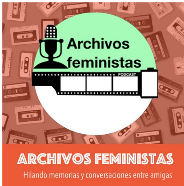
Flyer Podcast Archivos Feministas . Diseño: Panchiba Barrientos y María Stella Toro

Para mayores informaciones y contactos pueden seguir a Archivos Feministas a través de su instagram @archivos feministas o pueden escribirle a su equipo a archivosfeministas@gmail.com