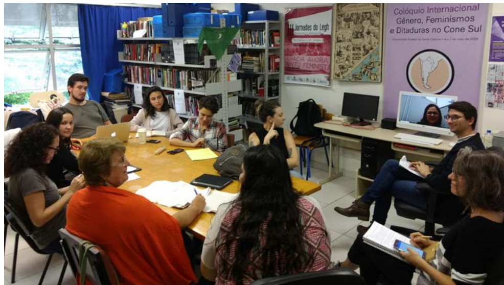
Bastidores do Projeto Mulheres de Luta: uma das reuniões com a equipe para a construção coletiva dos resultados do Projeto.

personais e políticas de mulheres e de grupos de mulheres na sua construção enquanto feministas, buscando salientar a atuação destas mulheres em diferentes espaços políticos, culturais e institucionais.