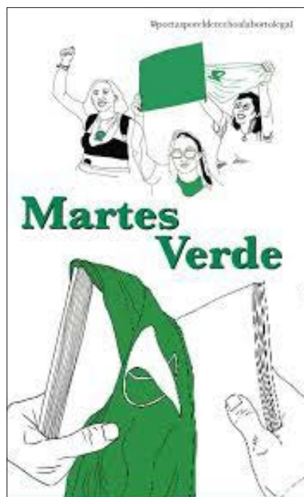
Tapa de Libro, 2018, ilustración: Florencia Basso.