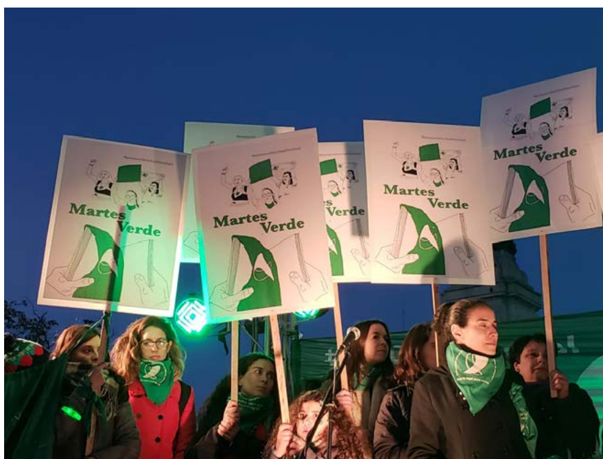
Presentación del libro Martes Verde . Plaza del Congreso de la Nación Argentina, 31 de julio de 2018.